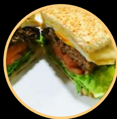
HAMBURGUER FONTELUZ 536