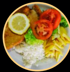
SNACK 10 570