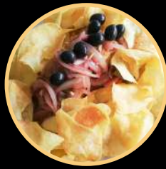
BACALHAU À FONTELUZ 502/503