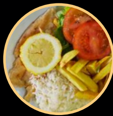
SNACK 09 569