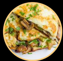
OMELETE DE COGUMELOS 589