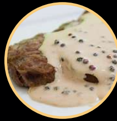
BIFE PIMENTA GRÃO 512/513