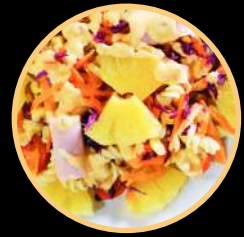
SALADA TROPICAL 902