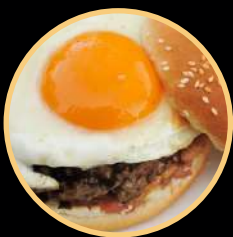
EGGBURGUER MISTO 535