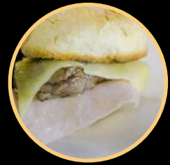
PREGO NO PÃO 552