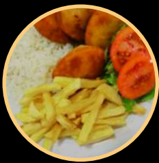
SNACK 05 565