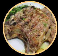
COSTELETÃO GRELHADO 518