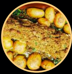
BACALHAU COM BROA 500/501