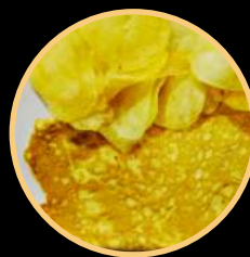
OMELETE SIMPLES 580