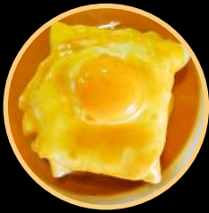
FRANCESINHA ESPECIAL 541