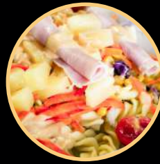
SALADA ITALIANA 900