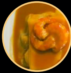
FRANCESINHA MARINHEIRO 543