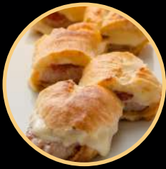
HOT DOG FONTELUZ 558