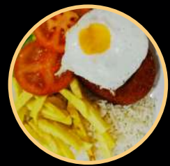
SNACK 12 572