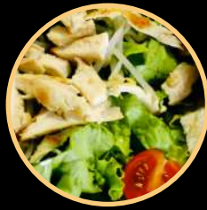
SALADA CAMPESTRE 687