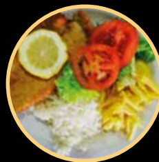
SNACK 10 570