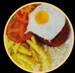
SNACK 12 572