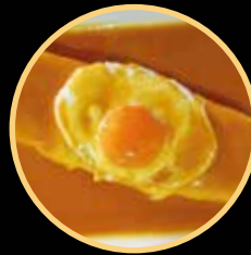
CACHORRO ESPECIAL 550