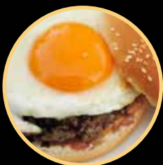
EGGBURGUER MISTO 535