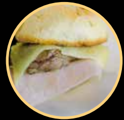
PREGO NO PÃO 552