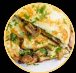
OMELETE DE COGUMELOS 589