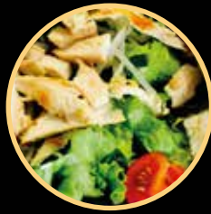
SALADA CAMPESTRE 687