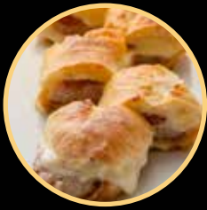
HOT DOG FONTELUZ 558