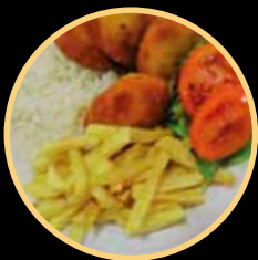
SNACK 05 565