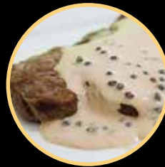
BIFE PIMENTA GRÃO 512/513