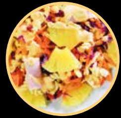
SALADA TROPICAL 902