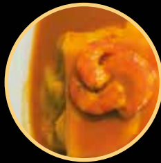
FRANCESINHA MARINHEIRO 543