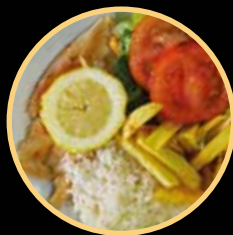
SNACK 09 569