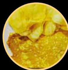
OMELETE SIMPLES 580