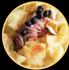
BACALHAU À FONTELUZ 502/503