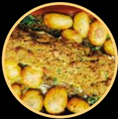
BACALHAU COM BROA 500/501