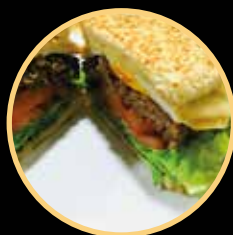
HAMBURGUER FONTELUZ 536