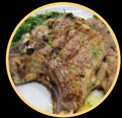
COSTELETÃO GRELHADO 518