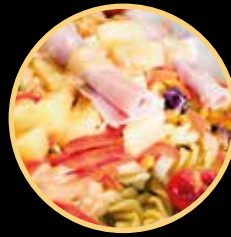
SALADA ITALIANA 900